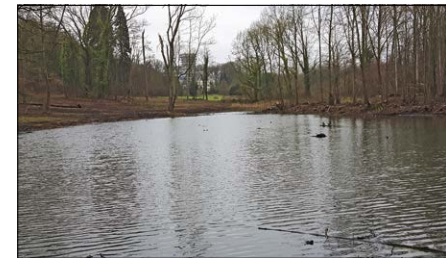
Herstelde vijver in Meldertbos met uitzicht op het kasteel

In Meldertbos, erkend als natuurreservaat en ook als cultureel erfgoed, heeft Natuurpunt gekozen om het vroegere uitzicht van Engels landschapspark te herstellen, o.a. met steun van een Europees Life Project. De vroegere gras- en hooilanden tonen intussen dank zij het beheer terug hun bloemrijke pracht. Eén van de twee drooggevallen vijvers is terug opgeknapt en gevuld met water.