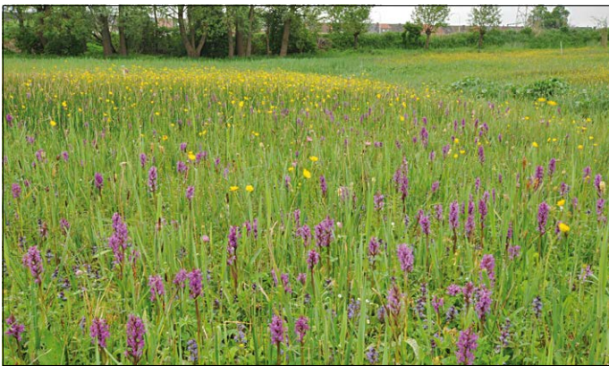
Hooiland met duizenden orchideeën in het Aardgat

De vallei van de Schoorbroekbeek of Nermbeek in natuurreservaat Rosdel en de valleien van Menebeek en Jordaen in Mene-Jordaen zijn diep ingesneden in het agrarische leemplateau. Ze hebben een hoge natuur- en landschappelijke waarde. Kalkrijke en soortenrijke graslanden wisselen af met broekbossen en versterkte relictten van oude boskernen.