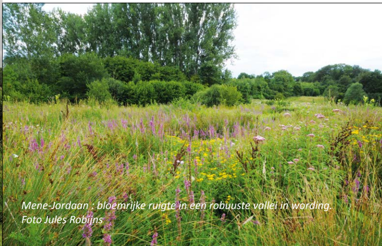
Mene-Jordaen : bloemrijke ruigte in een robuuste vallei in wording.

De Mene- en Jordaanvallei is deels gelegen in de ruilverkaveling Hoegaarden maar voor een nog groter gedeelte binnen de lopende ruilverkaveling Willebringen. Natuurpunt bouwde hier al een natuurgebied van 110 ha uit. De vereniging komt nu op voor de uitbouw van een robuuste vallei en voor natuurontwikkeling op de hellende valleiflanken.