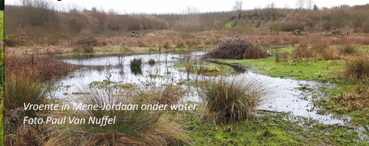
Vroente in Mene-Jordaen onder water.

De veel te diepe beekruiming in de Getebeemden werd ongedaan gemaakt. Het waterpeil steeg terug en de beemden herkregen hun nat karakter.