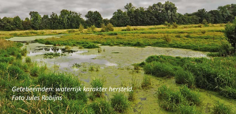
Getebeemden: waterrijk karakter hersteld.

Langs de Grote Gete in de Hoegaardse deelgemeente Rommersom liggen de Getebeemden. Natuurpunt heeft ongescheurde graslanden met ongeschonden microreliëf (bulten en slenken) kunnen verwerven en definitief beschermen.