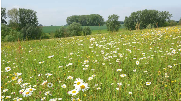
Natuurontwikkeling in Rosdel: bloemrijke droge kalkgraslanden op de valleiflank