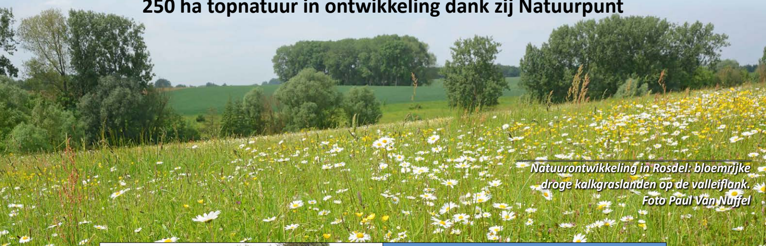
Natuurontwikkeling in Rosdel: bloemrijke droge kalkgraslanden op de valleiflank.

Rosdel, Meldertbos, Mene-Jordaan, Getebeemden en Aardgat: 250 ha topnatuur in ontwikkeling dank zij Natuurpunt