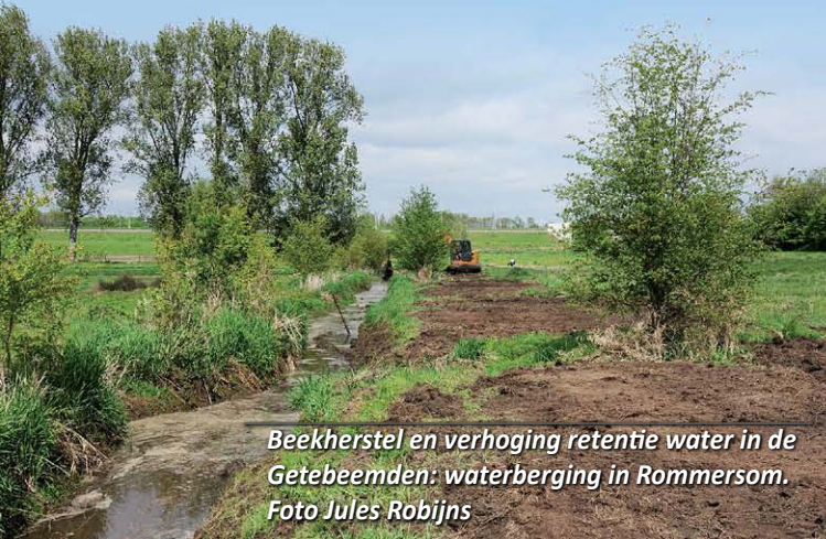
Beekherstel en verhoging retentie water in de Getebeemden: waterberging in Rommersom.

De Schoorbroekbeek-Nermbeek in Rosdel (Hoegaarden) en de Mene- en Jordaanvallei (Willebringen, Meldert, Hoksem en Oorbeek) zijn diep ingesneden in het leemplateau.