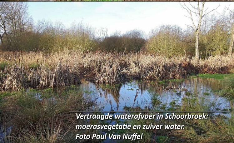
Vertraagde waterafvoer in Schoorbroek: moerasvegetatie en zuiver water. Foto Paul Van Nuffel