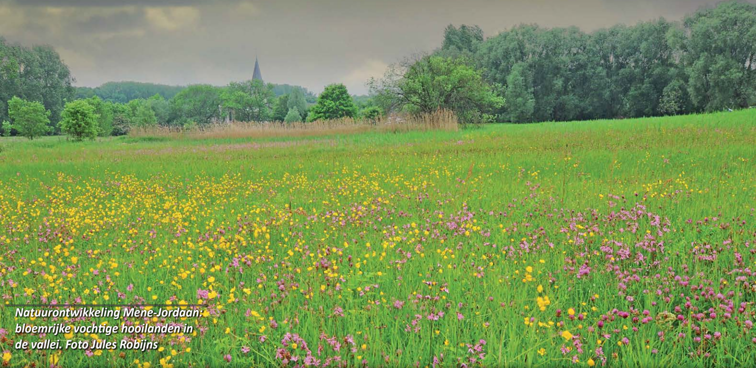
Natuurontwikkeling Mene-Jordaan: bloemrijke vochtige hooilanden in de vallei.