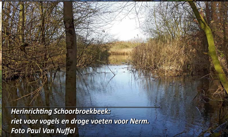
Herinrichting Schoorbroekbeek: riet voor vogels en droge voeten voor Nerm.