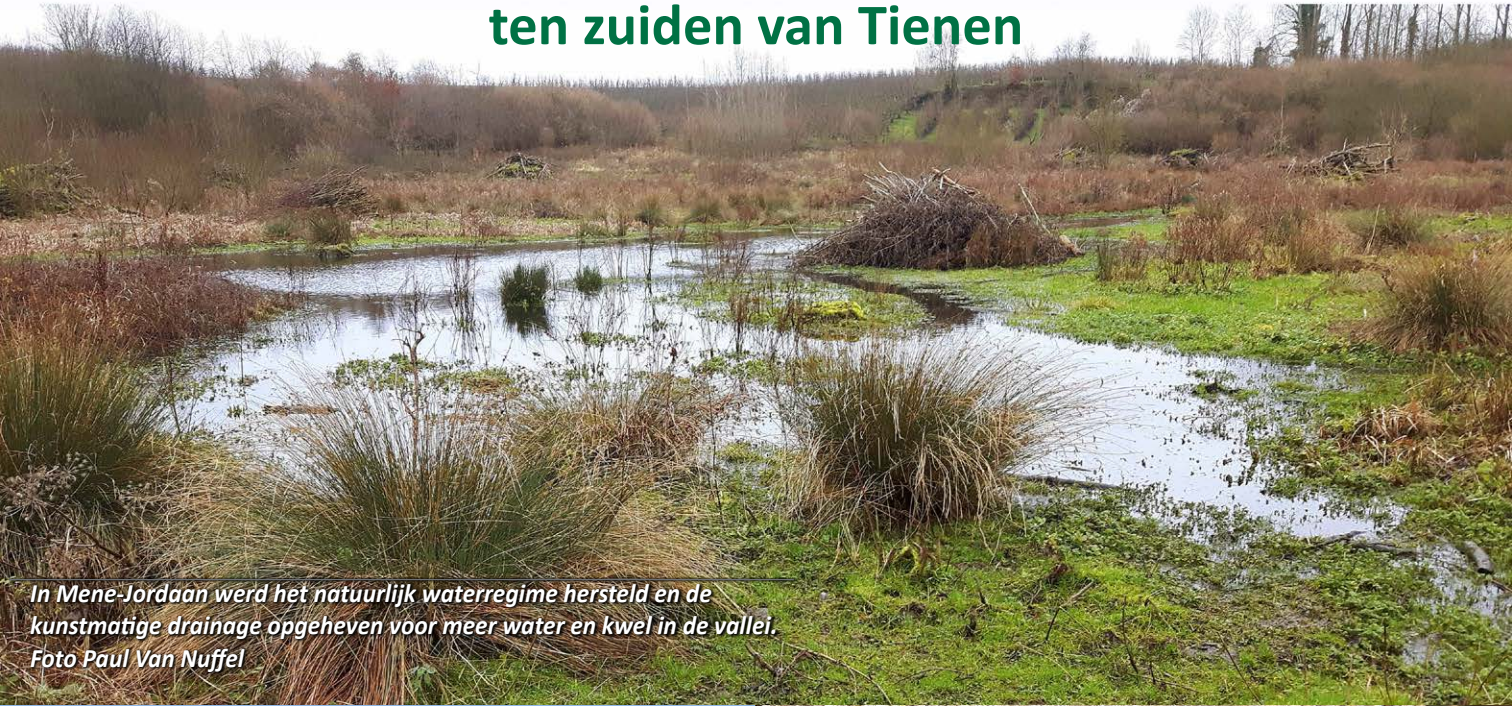
In Mene-Jordaan werd het natuurlijk waterregime hersteld en de kunstmatige drainage opgeheven voor meer water en kwel in de vallei.

De Hoegaardse valleien vormen samen met de Getebeemden en Het Aardgat een klimaatbuffer ten zuiden van Tienen