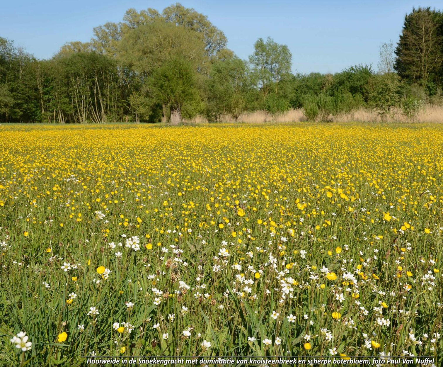
Hooiweide in de Snoekengracht met dominantie van knolsteenbreek en scherpe boterbloem