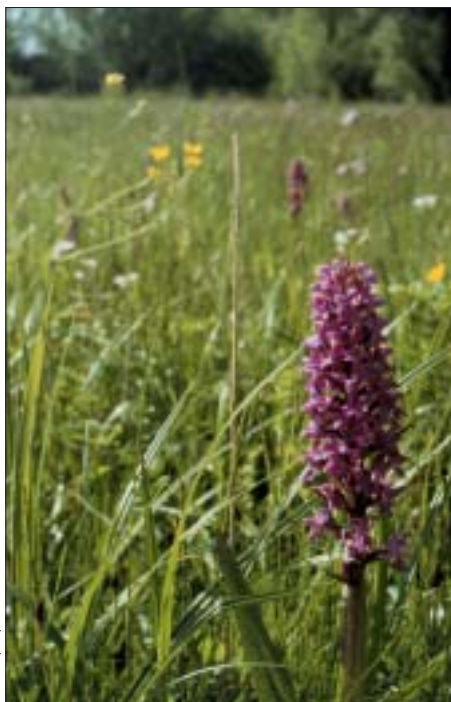
Hooiland, dit verkrijgen we niet door iets minder te mesten, maar door natuurbeheer.

Deze gebieden vormen de schatkamers voor natuur in onze streek en zijn een garantie voor duurzaamheid. Dat gaat hier en vandaag niet meer vanzelf, er is geen ongerepte natuur meer voorhanden in Vlaanderen. Je krijgt die hoogwaardige natuur niet terug door exploitatie voorop te laten staan, wel door echt natuurbeheer in functie van maximale biodiversiteit.