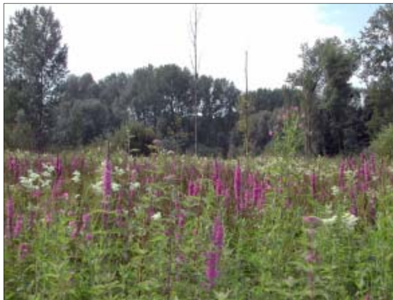
Natuurbeheer is ook het herstellen van het oorspronkelijk waterpeil, waardoor terug rietmoerassen en ruigten kunnen ontstaan, die belangrijk zijn voor riet- en watervogels. Hiervoor is wel een behoorlijke oppervlakte natuur nodig.

Ons doel: 50 000 euro of 2 miljoen oude Belgische franken samenbrengen voor het eind van dit jaar. Voor dat bedrag gaan we in deze fondsenwervingscampagne. Op die manier willen we een krachtig signaal geven dat ons model gedragen is. Word daarom vandaag nog donateur, peter of meter en laat zien dat je begaan bent met duurzame natuur.