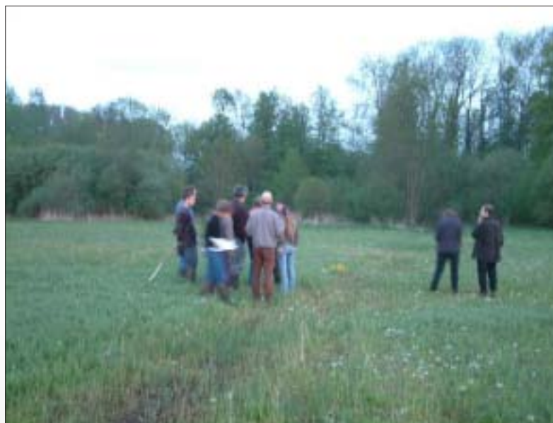
Zwartebos: 'Blauwgraslanden met soorten als gele en blauwe zegge komen maar met enkele 10-tallen ha in Vlaanderen voor. Gratis beheer en doorgegeven aan toekomstige generatie door vrijwillig natuurbeheer.

De reservatenwerkgroep van de afdeling werkt in 2004 aan de voorbereiding van de volgende beheersplannen of uitbreidingen van bestaande erkenningsdossiers: uitbreiding van het Koebos met het Langenbos (Bierbeek), en van de Snoekengracht met de vallei van de Vondelbeek en de kop van het Kautemveld, de boomgaard in de Kleinbeek te Roosbeek en het aansluitend terrassenlandschap aan de spoorweg in Kumtich, de uitbreiding van het reservaat van Mene-Jordaan en van het reservaat Rosdel.