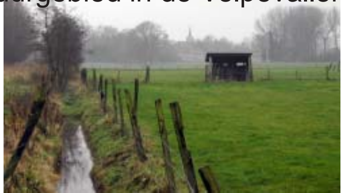
Molensteen, een eerste ongeschonden landschap op de oevers van de Velpe, niet ver van de Bron te Opvelp.

reservatenwerking binnen de vroeger regionale vereniging Natuur en Landschap begon in 1975 met de Snoekengracht te Verrijck. Toen werd voor het eerst een perceeltje van 4 ha gehuurd, de huidige orchideeënpercelen. De inkt van de overeenkomst was nog niet droog of we werden geconfronteerd met de plannen tot rechtekking van de Velpe. Dit over heel de loop van Opvelp tot Halen aan de provinciegrens. Jarenlange strijd voor het behoud van een natuurlijke en meanderende Velpe leverde als resultaat op dat de Velpe een levende en kronkelende rivier bleef. Ondertussen groeide de Snoekengracht uit tot één van de mooiste dottergraslanden van Vlaanderen met 6000 bloeiende brede orchissen in mei. De 4 ha van toen zijn nu uitgegroeid tot een complex van 30 ha met uitlopers in de vallei van de Kleine en Grote Vondelbeek en een natuurakker (voor de gorzen) in het Kautemveld.