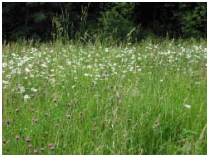
Knoopkruid en margrietten bloeien nergens zo uitbundig als in het natuurgebied de Zeyp.