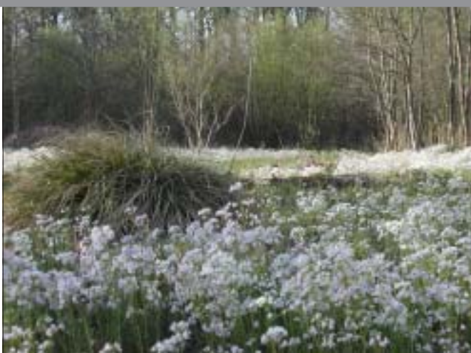
Onbemeste hooilanden zijn zeldzaam geworden en verdienen dan ook het nodige beheer.

We maken ook een verschil doordat we met een hele groep mensen wat gisteren nog braak was weten te herkennen en te laten erkennen als natuurgebied. Omdat we openstaan voor participatie van de buurt en er samen natuur voor iedereen van maken. Doordat we ons effectief inzetten voor het beheer van de gebieden en erin slagen met vele vrijwilligers het nodige werk te verzetten. Door de duizenden geleide bezoeken die we organiseren en de kansen die we mensen geven om van natuur te genieten en zelf mee vorm te geven aan de veiligstelling van natuur in hun omgeving. Dat is het model van Natuurpunt. Betrokkenheid, inzet, zelfwerkzaamheid en openheid naar de samenleving zijn de sleutels.