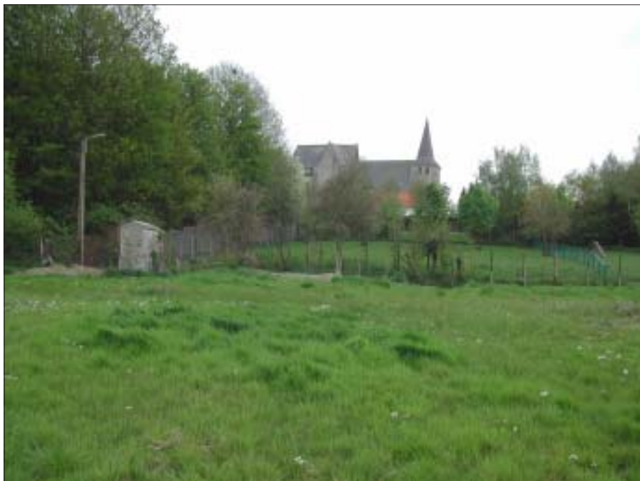
De vochtige hooilanden en kapel Sint-Lucia langs de Velpe ter hoogte van Verrijck (Boutersem), een natuurgebiedje midden in het dorp.

De reservaatprojecten die nu een oppervlakte beslaan van 28,8 ha zullen kunnen groeien tot circa 65 ha. Maar toch blijft de ruilverkaveling daar in de middenloop van de brede Velpevallei een omvangrijke ingreep waar we met heel gemengde gevoelens tegenover staan. We willen het tij nog keren door versterking van de aanwezige natuur. Daarom werken we hard om het project Paddenpoel-Velpevallei niet alleen in het kader van de ruilverkaveling maar ook op eigen kracht uit te breiden. Net als onze aanwezigheid het verschil voor natuur maakte bij de ruilverkaveling Hoegaarden, willen we door onze aanwezigheid met het project Paddenpoel-Velpevallei het verschil maken in de ruilverkaveling Vissenaken. Het project Paddenpoel-Velpevallei dus als hefboom voor meer natuur in het deel van de Velpevallei stroomafwaarts van de Aarschotsesteenweg. We doen hier werkelijk een run tegen de tijd. Dit mag niet mislopen door een gebrek aan restfinanciering.