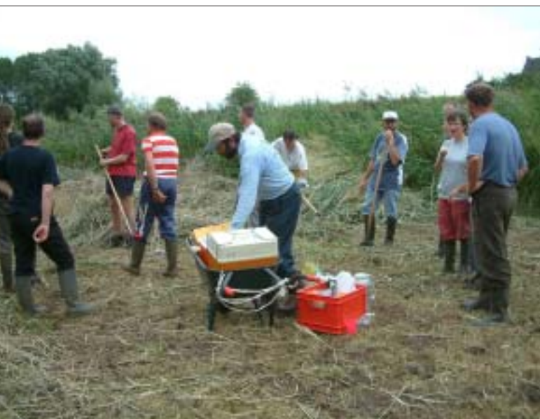
Zomerwerkdag in de Mene-Jordaan. De werkdagen in de natuurgebieden zijn een jaarlijkse traditie en getuigen van de grote betrokkenheid van de vrijwilligers bij het natuurbeheer.

Tijdens de eerste helft van 2004 werden de volgende gebieden als natuureservaat erkend: Koebos in Bierbeek en Lubbeek, Rozendaalbeek in Vissenaken-Tienen en Zwartebos in Bierbeek. Dat betekent dat deze gebieden nu ook officieel het statuut van natuureservaten hebben en dat de minister voor leefmilieu het beheersplan goedgekeurd heeft. Voor elk werd een gedetailleerd natuurstreefbeeld vastgesteld. De eerste maal na drie jaar, en vervolgens om de vijf