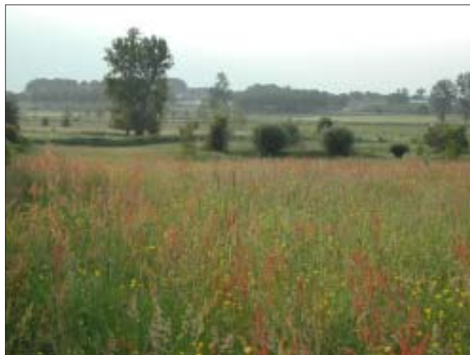
Ter hoogte van de paddepoel wordt de velpevallei een echte vallei met een zeer open karakter.