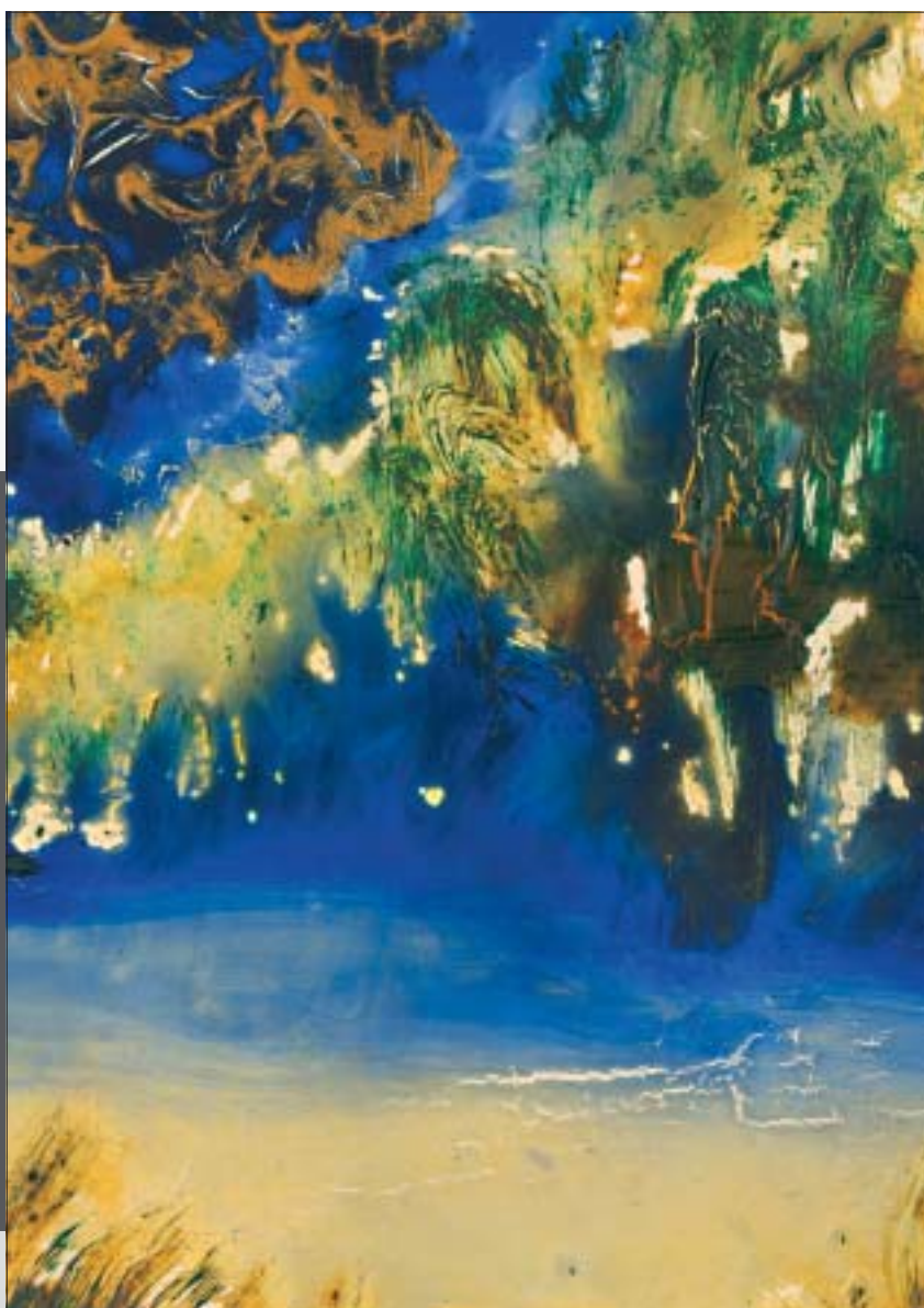
De Beemden, geschilderd door Syl Peeters.

in de holte van de knotwilg dubt een bosuil hij broedt zijn wijsheid