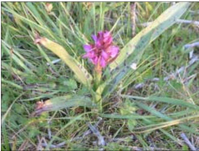
Nieuwe vindplaats van brede orchis in Mene-Jordaan, dankzij het goede beheer.

Luk Briesen komen vergapen aan hoe de natuurontwikkeling hier loopt. De in 2000 in beheer genomen akkers vormen nu een zee van bloeiende graslanden vol zeldzame soorten, dikwijls met een kalkminnend karakter, zoals aardaker, borstelkrans en voor Vlaanderen unieke orchideeën. Elk weekend worden er nieuwe vondsten gedaan. Ook voor de vogels gaat het de goede richting uit. In de Rosdel en Mene-Jordaan waren eind april terug 3 zangposten van de nachtegaal, waren er meer zangposten dan ooit van de sprinkhaanzanger en hopen we op kolonisatie door de roodborsttapuit. Bij een recent keveronderzoek werden verschillende soorten gevonden die als